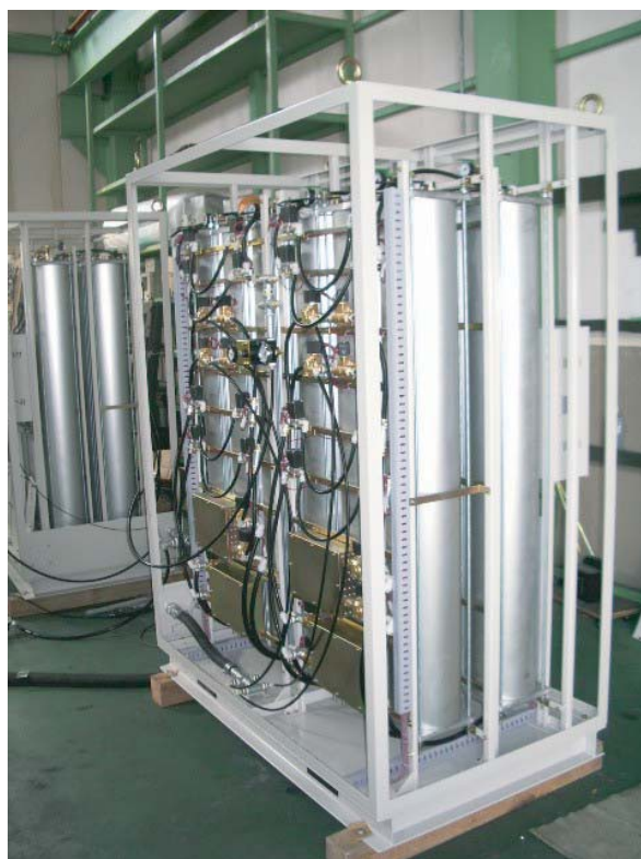
90% 12Nm 3 /h